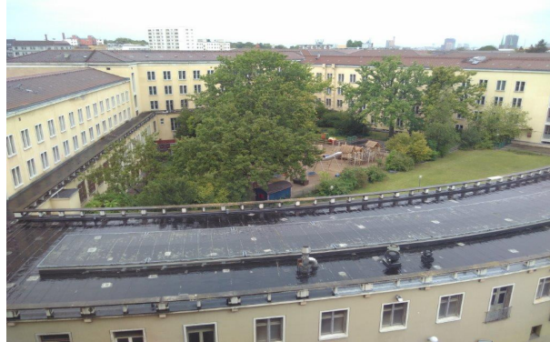
Grüner Innenhof, im Vordergrund K2

Der große, grüne Innenhof zwischen den Bauteilen H2r und H2lg sowie G2 und K2 wird zum Teil von der Kita am Ehrenhof genutzt.