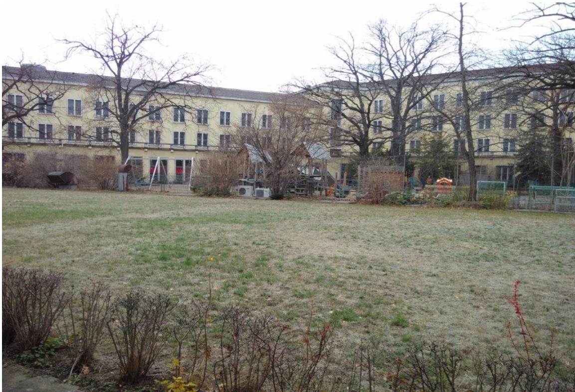
Blick in den grünen Innenhof

Allerdings fehlt ein Zugang von außen in den Innenhof.